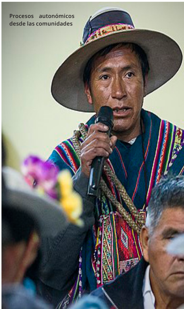
Procesos autonómicos desde las comunidades

La “Autonomía” es comprendida como el autogobierno, es el ejercicio de la libre determinación de las naciones y los pueblos indígena originario campesinos, cuya población comparte territorio, cultura, historia, lenguas, y organización o instituciones jurídicas, políticas, sociales y económicas propias (Art. 289, CPE). En este marco, el Gobierno Autónomo Indígena Originario Campesino de Salinas, tiene la visión de fortalecer la producción agropecuaria orgánica, su industrialización, transformación, comercialización de los recursos naturales renovables y no renovables (Art. 8). Según el Art. 15, el territorio, está organizado por Ayllus y/o Markas, dónde el Taypi (centro) del Gobierno Autónomo Indígena Originario Campesino de Salinas (GAIOC - Salinas), es el centro ancestralmente reconocido como “Salinas de Garci Mendoza”.